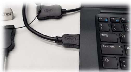
Tilkobling egen bærbar ved hjelp av HDMI-kabel