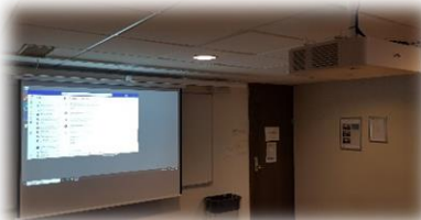
Bilde fra laptop eller UiB PC kommer opp på projektor